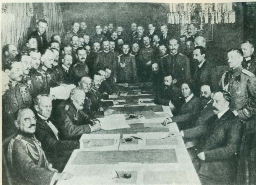
Armistice de Brest-Litovsk (15 décembre 1917). A gauche, le Prince Léopold de Bavière signant le traité. A droite, Ioffé, président de la délégation du Gouvernement bolchevik.