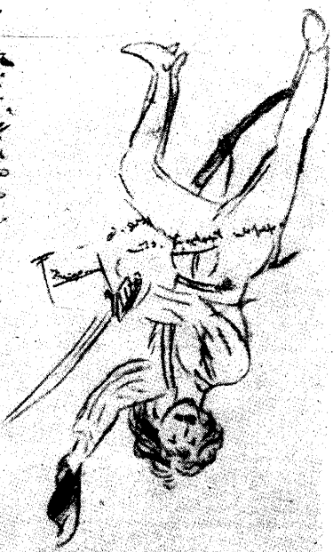
Seite 15 des Manuskripts, Kapitel „I. Feuerbach“ (siehe Seite 31/32)

Handwritten notes in the upper right margin, including the name "Feuerbach" and other illegible scribbles.