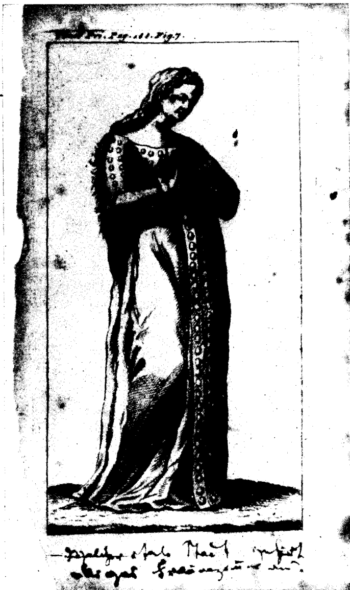
Beilage zum Brief von Marx an Engels vom 29. Januar 1853