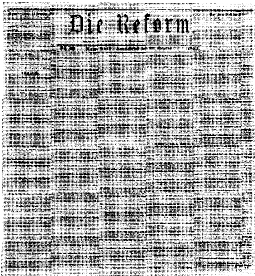
„Die Reform“ vom 17. September 1853 mit der Fortsetzung von Adolf Cluß' Artikel „Das ‚beste Blatt der Union‘ und seine ‚besten Männer‘ und Nationalökonomem“ [310]