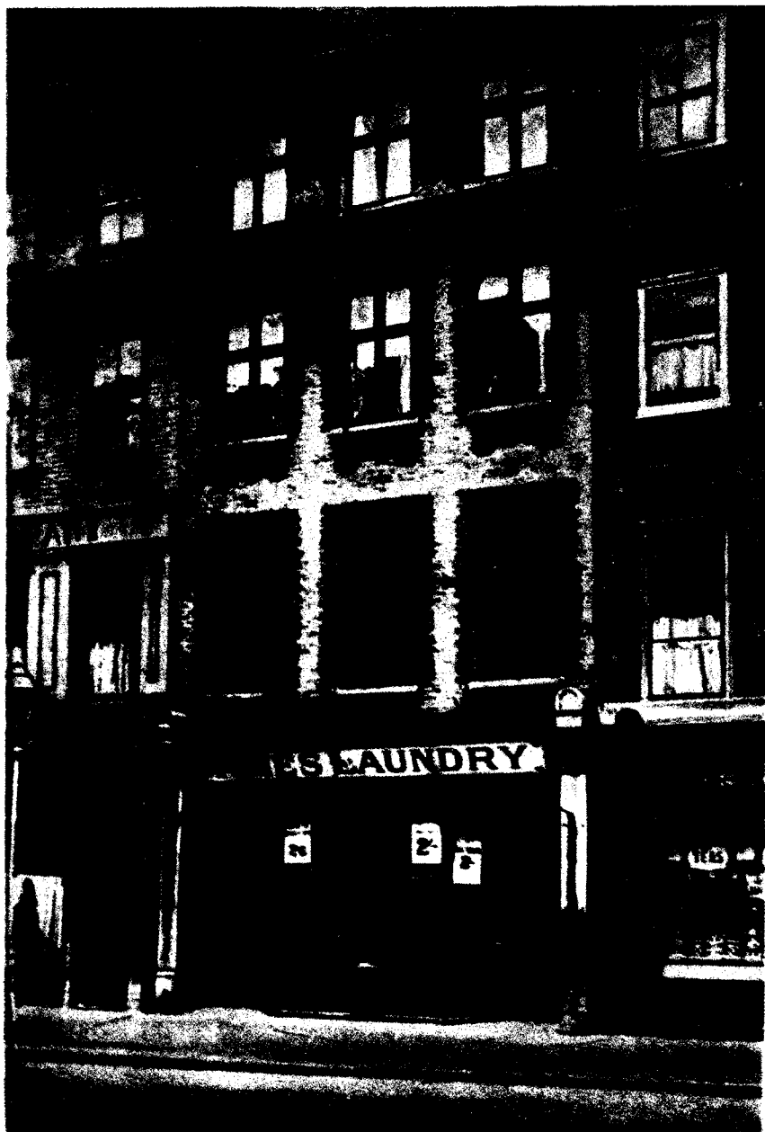
Haus in London (28, Dean Street, Soho), in dem Marx von 1850 bis 1856 lebte