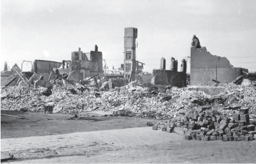
Gebombardeerd Rotterdam in 1940