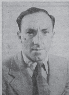
A. de Heus

In dit verband willen wij er nog even op wijzen, dat nog steeds geen wijziging is gebracht in de financiële verhouding Rijk