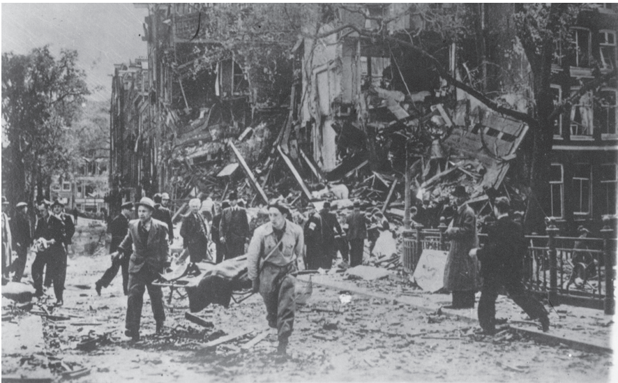
Bombardement op de blauwbrugwal in Amsterdam, 10 mei 1940