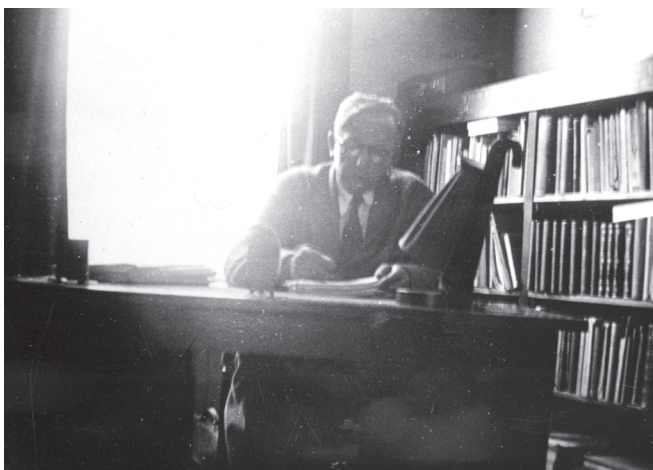
Sneevliet in zijn werkkamer

De laatste verkiezing voor de bezetting, voor de Provinciale Staten in 1939, liet dan ook een lichte groei zien. De RSAP had zich gestabiliseerd en zelfs iets versterkt.