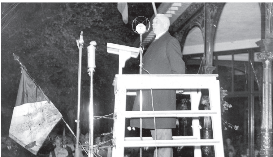
Minister-President Colijn houdt een toespraak in de buitenlucht

De man bleek een volleerde dominee te zijn en met een gedragen stem vroeg hij God om de zegen voor de bijeenkomst, voor ons geliefd vorstenhuis, voor de regering, enzovoort, enzovoort. En daarna: 'Amen'. Colijn begon te spreken en meteen werd er in koor het beloofde debat geëist. Waar hij het ding vandaan haalde mag Joost weten, maar de voorzitter begon plotseling met een grote koperen bel te zwaaien hetgeen een hels kabaal veroorzaakte. Met overslaande stem dreigde hij weer met de politie. Weer werd het even stil en Colijn hervatte zijn betoog. Maar toen hij begon over de noodzaak van handhaving van orde en gezag, klonk het plotseling met heldere stem: 'Het stinkt hier naar petroleum!' [Colijn was van 1914 tot 1922 directeur van de Bataafsche Petroleummaatschappij] Het daverende gelach dat hier op volgde werd beantwoord met geschreeuw van de aanwezige 'Anti's' en heftig gebel van de voorzitter. Het werd een kakofonie van geluiden waaruit ineens een krachtig gezongen Internationale opklonk. De Anti's probeerden dit tegen te gaan met het zingen van het Wilhelmus , hetgeen de verwarring ten top voerde. Het werd een complete chaos waarin echter De Internationale duidelijk