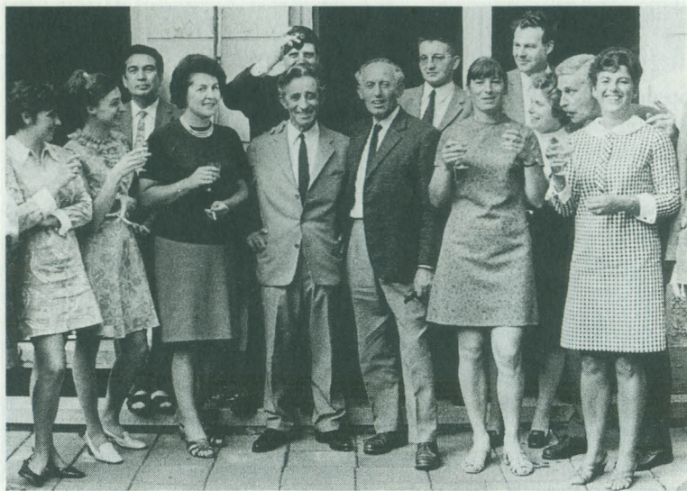
Feest op het Rijksinstituut voor Oorlogsdocumentatie, zomer 1970.