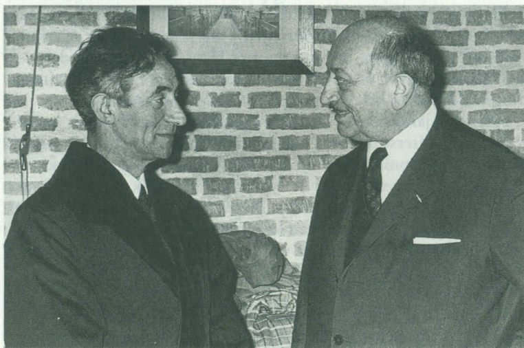
Simon Wiesenthal en Ben Sijes na de inaugurele rede, 26 november 1970.